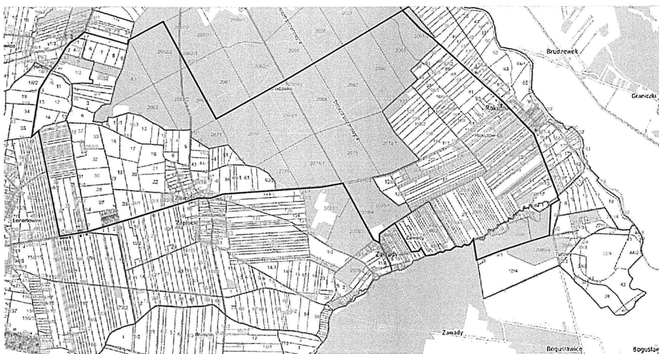
— granice obszaru objętego sporządzeniem miejscowego planu zagospodarowania przestrzennego dla części obrębów ewidencyjnych Rokietno, Turów, Zawady, Grodzisko, Zawidowice, Lenartowice, gmina Pleszew

Załącznik Nr 1 do uchwały Nr ..... Rady Miejskiej w Pleszewie z dnia ..... 2024 r.